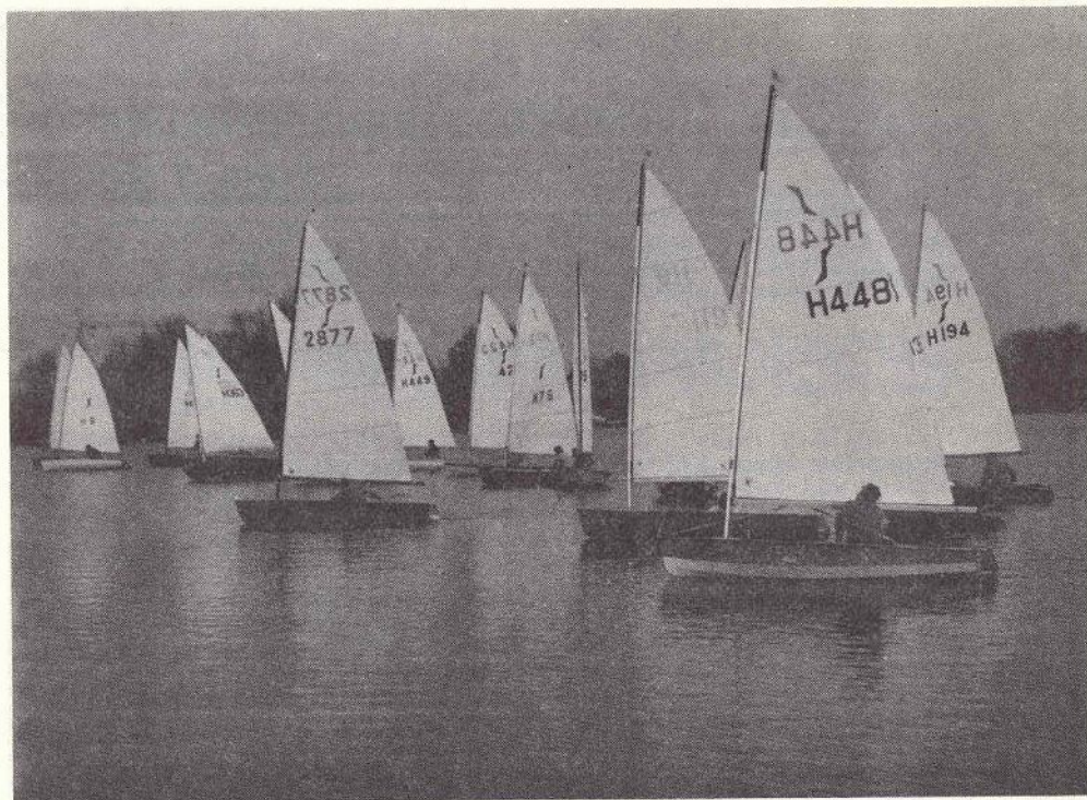
Dobberen op Aegir