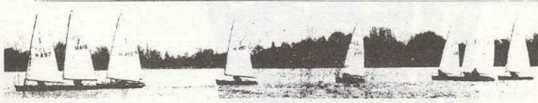
REUWIJK - Duidr afbeelding: eenzeiler op de wateren van Reeuwijk het seizoen 1980 was start.

De door weersomstandigheden van allerlei slag beïnvloede zailseizoen startte op woensdag 2 april met een helder en zonnig vroege middag en de wind was op dreig van later op de dag een afnemende pufje, de naar zomerse waarden toekeernde zonnig in de namiddag.